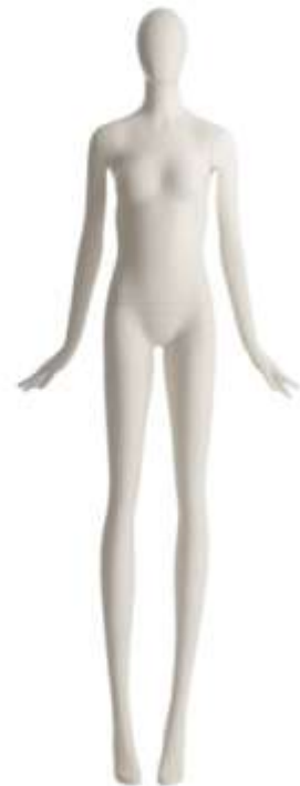
955 - 18

Altezza / Height 190 Larghezza / Width 59 Profondità / Depth 63 Colla / Neck Size 29 Seno / Breast 75 Vita / Waist 65 Fianchi / Hips 82 Taglia / Size 38 Tacco / Heel 10 Scarpa / Shoe 37 Finitura/Color WHITE SF Base / Base Rot Metallo 35X45 Perno / Fixing Pieda/Point Polipassivo/Coil Tasto / Head 18