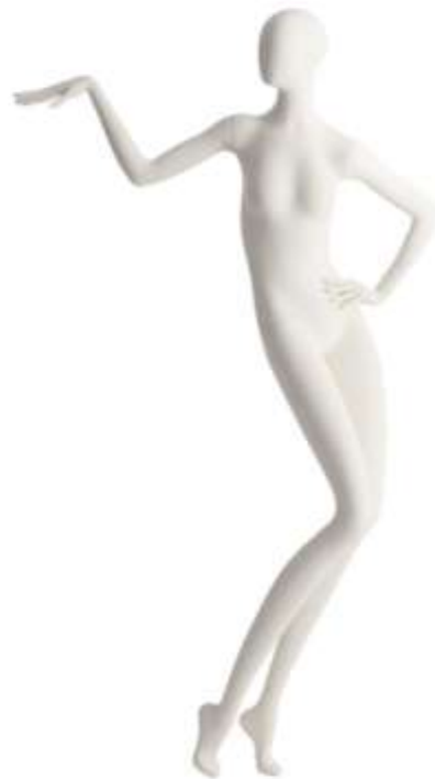
951 - 18

Altezza / Height 192 Larghezza / Width 93 Profondità / Depth 72 Colla / Neck Size 29 Seno / Breast 75 Vita / Waist 89 fianchi / Hips 82 Taglia / Size 38 Tacco / Heel 10 Scarpa / Shoe 37 Finitura/Color WHITE SF Base / Base Rot Metallo 35X48 Perno / Fixing Piede/Toot - Polipassivo/Calf Tasto / Head 18