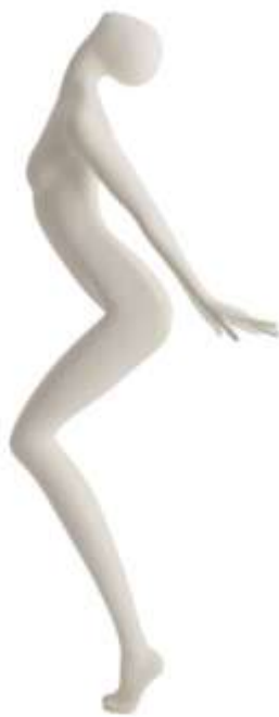
950 - 18

Altezza / Height 192 Larghezza / Width 93 Profondità / Depth 72 Colla / Neck Size 29 Seno / Breast 75 Vita / Waist 89 fianchi / Hips 82 Taglia / Size 38 Tacco / Heel 10 Scarpa / Shoe 37 Finitura/Color WHITE SF Base / Base Rot Metallo 35X48 Perno / Fixing Piede/Toot - Polipassivo/Calf Tasto / Head 18