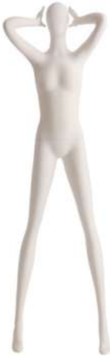
953 - 18

Altezza / Height 209 Larghezza / Width 59 Profondità / Depth 42 Colla / Neck Size 29 Seno / Breast 75 Vita / Waist 59 Fianchi / Hips 81 Taglia / Size 38 Tacco / Heel 10 Scarpa / Shoe 37 Finitura/Color WHITE SF Base / Base Rot Metallo 35X48 Perno / Fixing Pieda/Point Polipassivo/Coil Tasto / Head 18