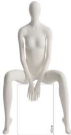
954 - 18

Altezza / Height 209 Larghezza / Width 59 Profondità / Depth 42 Colla / Neck Size 29 Seno / Breast 75 Vita / Waist 59 Fianchi / Hips 81 Taglia / Size 38 Tacco / Heel 10 Scarpa / Shoe 37 Finitura/Color WHITE SF Base / Base Rot Metallo 35X48 Perno / Fixing Pieda/Point Polipassivo/Coil Tasto / Head 18