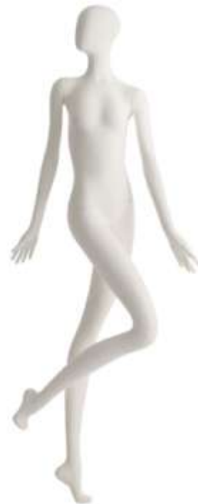
952 - 18

Altezza / Height 207 Larghezza / Width 113 Profondità / Depth 82 Colla / Neck Size 29 Seno / Breast 75 Vita / Waist 58 fianchi / Hips 79 Taglia / Size 38 Tacco / Heel 10 Scarpa / Shoe 37 Finitura/Color WHITE SF Base / Base Rot Metallo 35X45 Perno / Fixing Piede/Toot - Polipassivo/Calf Tasto / Head 18